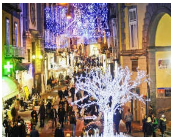
IL NATALE A NAPOLI