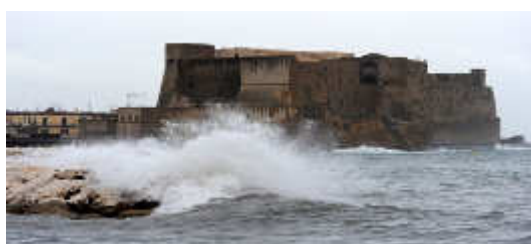
ALLERTE METEO NELLA CITTA' DEL SOLE