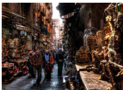
I PRESEPI DI SAN GREGORIO ARMENO