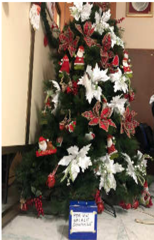
LA RACCOLTA FONDI