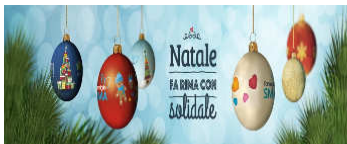
LA DOMUS PUERI E IL NATALE