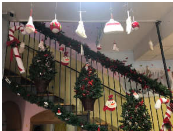
I NOSTRI ADDOBBI